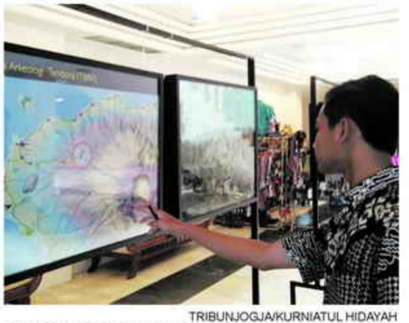
SEJARAH TAMBORA - Pengunjung pameran foto sedang melihat potret Gunung Tambora, dalam peringatan 200 tahun meletusnya Gunung Tambora, NTB di Hotel Inna Garuda Yogyakarta, Senin (16/11).

Banyak yang menyangka letusan gunung api terbesar di Indonesia adalah letusan Krakatau pada 1883. Ternyata ada yang lebih dahsyat dari letusan Krakatau, yakni Gunung Tambora di Nusa Tenggara Barat, yang meletus pada 1815 dengan volume materi vulkanik hingga 160 km 3 .